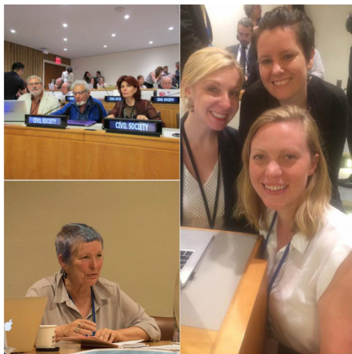
Miembros y el personal de WILPF participan en las negociaciones del Tratado sobre la Prohibición de las Armas Nucleares en las Naciones Unidas en Nueva York.

de conocimientos y experiencia. ¿Por qué no asociarte con ellos y organizarse juntos?