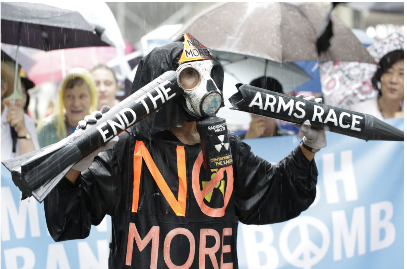
La Marcha de Mujeres para Prohibir la Bomba, junio de 2017 en Nueva York.

mas de una década, a la que a veces se refiere como la Iniciativa Humanitaria, debido a su énfasis en el impacto humanitario catastrófico de las armas nucleares. Desde el 2010, tanto como gobiernos, como la Federación Internacional de la Cruz Roja y de la Media Luna Roja, al igual que diversos organismos de las Naciones Unidas y organizaciones no gubernamentales emprendieron a trabajar juntos para replantear el debate sobre las armas nucleares. WILPF, a través de su participación en la Campaña Internacional para Abolir las Armas Nucleares (ICAN) - receptor del Premio Nobel de la Paz 2017- ha sido una parte central de esta iniciativa desde sus inicios.