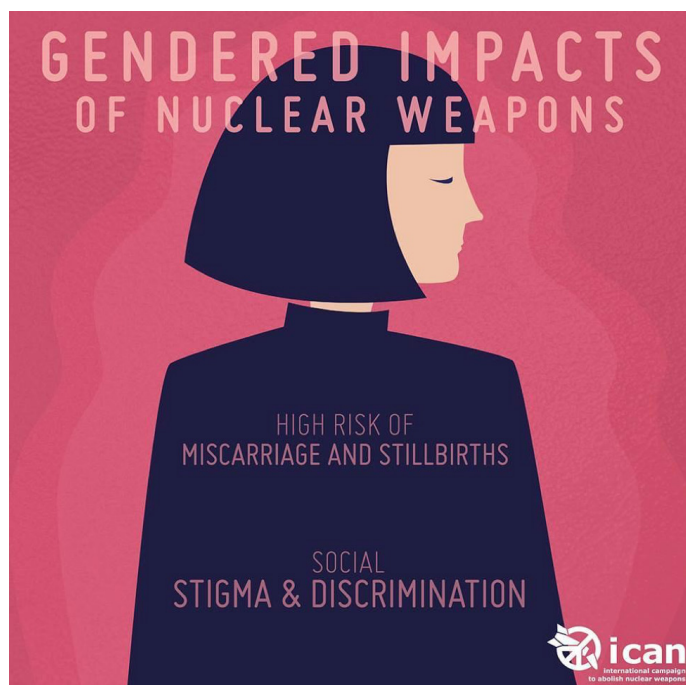
Campaña Internacional para Abolir las Armas Nucleares (ICAN), 2017.

Al igual que muchos otros tipos de armas, las armas nucleares tienen impactos de género. Las mujeres enfrentan una devastación singular por los efectos del uso de armas nucleares, como son los efectos de la radiación en la reproducción y la salud materna. En algunas comunidades donde se han realizado pruebas, los hábitos culturales y la responsabilidad de las mujeres las colocan en un mayor riesgo de exposición. Los estudios demuestran que las mujeres son más vulnerables a las radiaciones ionizantes que los hombres y las mujeres embarazadas expuestas a altas dosis de radiación ionizante corren el riesgo de perjudicar la salud de sus hijos, incluyendo el riesgo a las malformaciones, las discapacidades y el riesgo de muerte fetal.