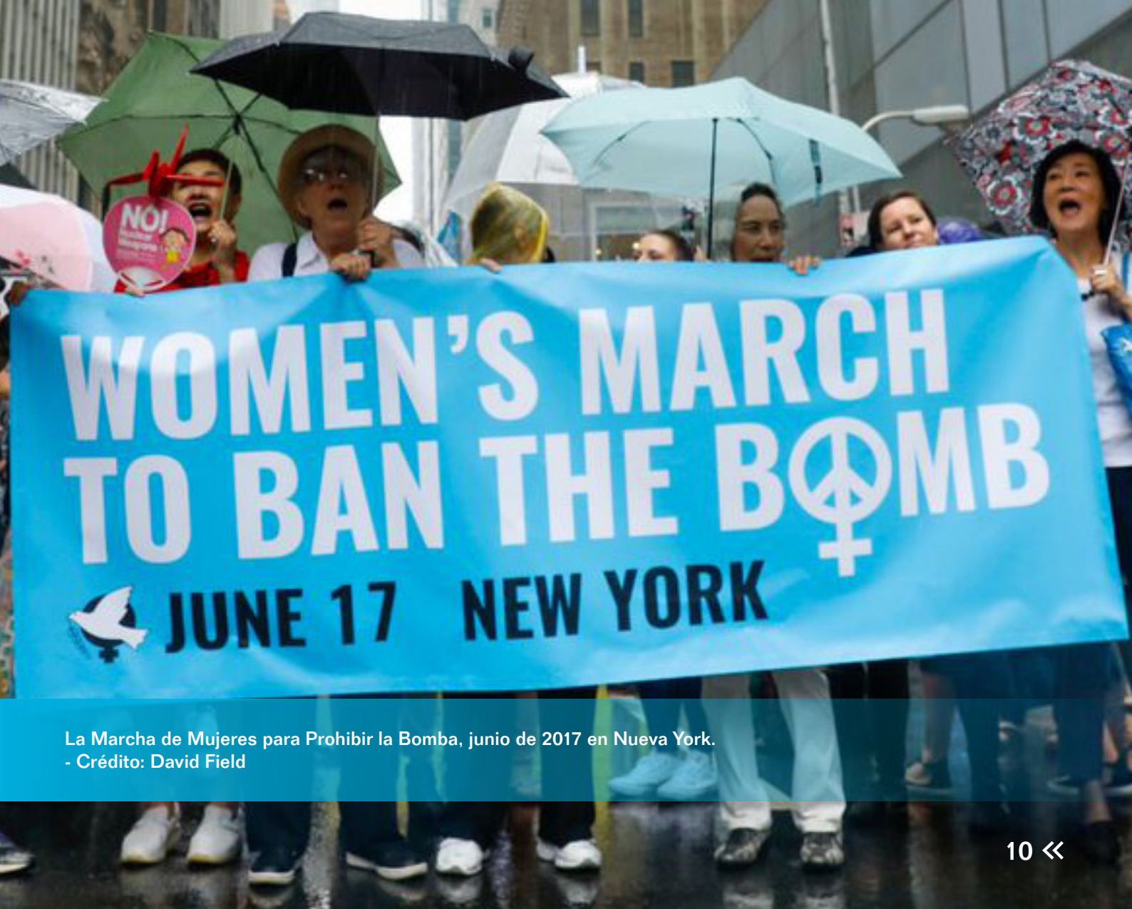
La Marcha de Mujeres para Prohibir la Bomba, junio de 2017 en Nueva York.