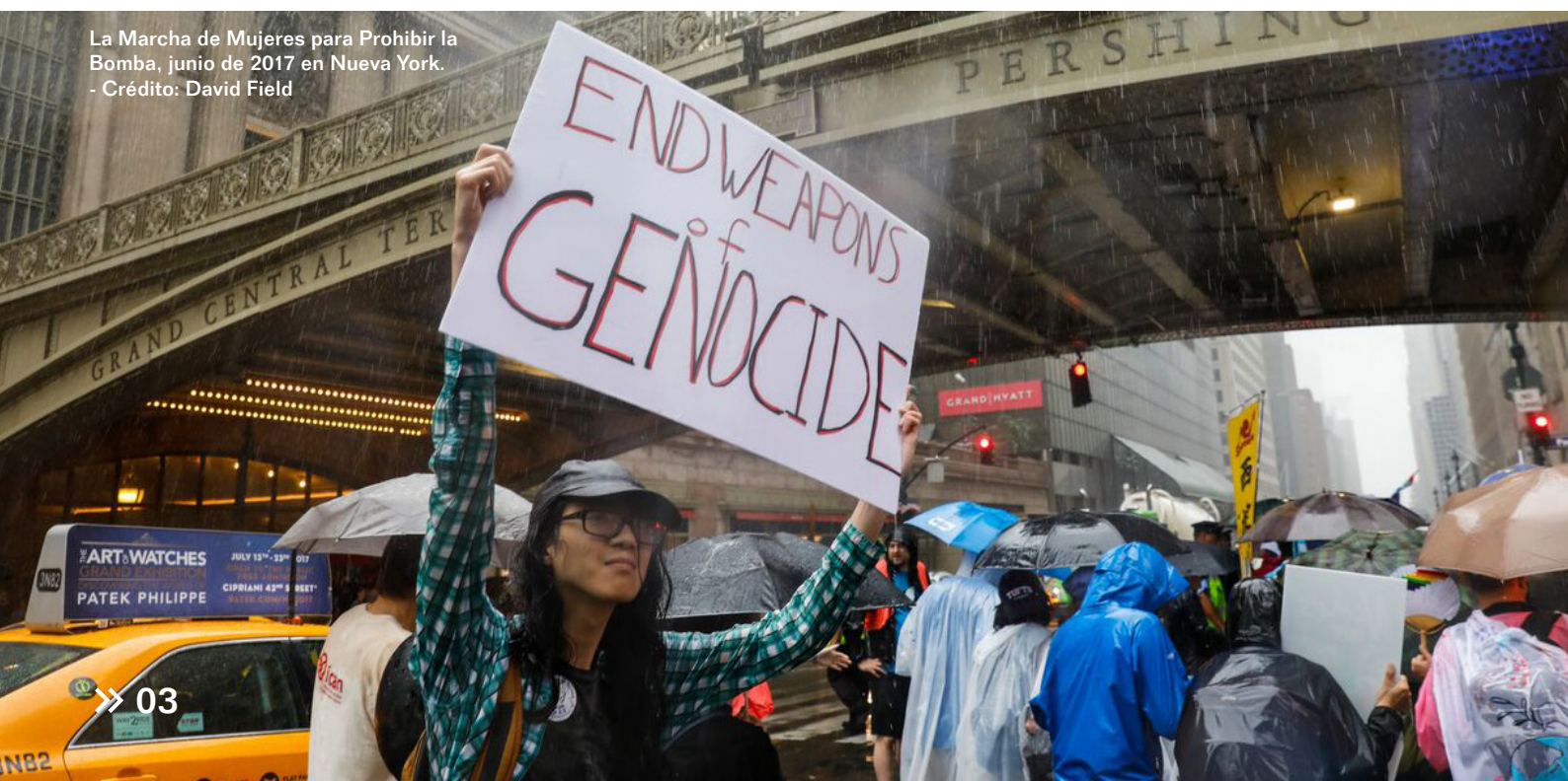
La Marcha de Mujeres para Prohibir la Bomba, junio de 2017 en Nueva York.

Esta guía de recursos está diseñada para ayudarnos a continuar con esa labor, trabajando con los gobiernos y otros en la sociedad civil con el fin de garantizar la rápida entrada en vigor y la implementación efectiva del Tratado. Proporcionamos una descripción general de lo que incluye el Tratado, ejemplos de esfuerzos anteriores, sugerencias para acciones futuras y dónde encontrar más información.