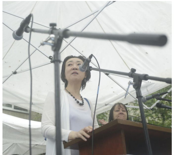
Kozue Akibayashi, Presidente Internacional de WILPF, se dirige a las multitudes en la Marcha de Mujeres para Prohibir la Bomba.

En el caso del tratado de prohibición, los de esta opinión vinculan las preocupaciones humanitarias con la debilidad, y afirman que los “hombres de verdad” tienen que “proteger” a sus países. Esto implica que el desarme es un objetivo poco realista, irracional e incluso afeminado. Los académicos de género y desarme han destacado y desafiado este discurso durante décadas (algunos de los cuales hemos enumerado al final de esta guía); con el TPNW tenemos una oportunidad increíble para confrontar e interrumpir esta narrativa dominante y para mostrar la efectividad de la acción colectiva para la seguridad global.