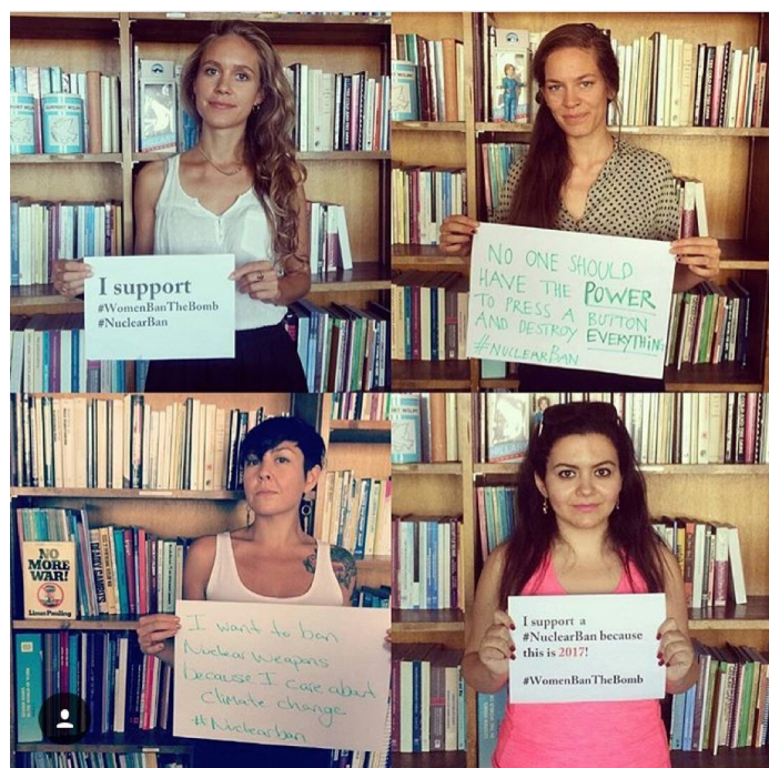
El equipo internacional de WILPF en Ginebra muestra su apoyo a la prohibición.

sus negociaciones. Escribimos algunos de los documentos informativos seminales sobre este Tratado (consulte la página web de recursos al final de esta guía) y proporcionamos análisis de expertos a lo largo de los procedimientos, ayudando a dar forma al lenguaje y enfoque de ciertos temas del Tratado. Impulsamos un tratado fuerte e integral para hacer una diferencia en el mundo. Reaching Critical Will, que es el programa de desarme de WILPF, ha asistido y proporcionado monitoreo y análisis de todas las reuniones relacionadas con el tratado de prohibición desde el inicio de la Iniciativa Humanitaria.