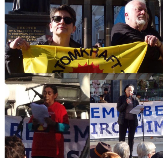
Miembros de WILPF participan en actividades en toda Australia en apoyo del tratado de prohibición.