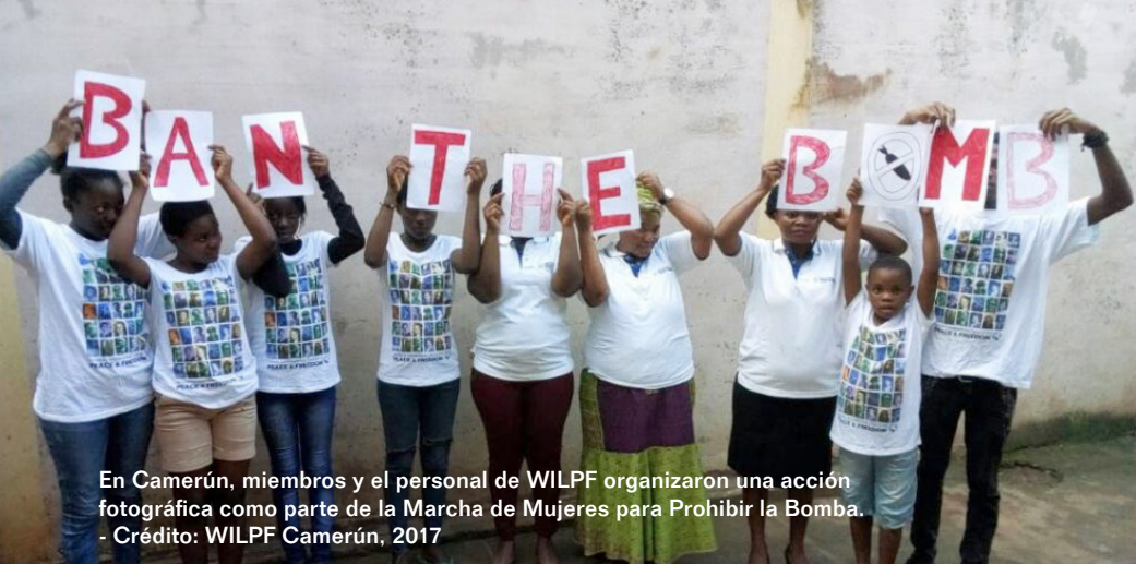
En Camerún, miembros y el personal de WILPF organizaron una acción fotográfica como parte de la Marcha de Mujeres para Prohibir la Bomba.