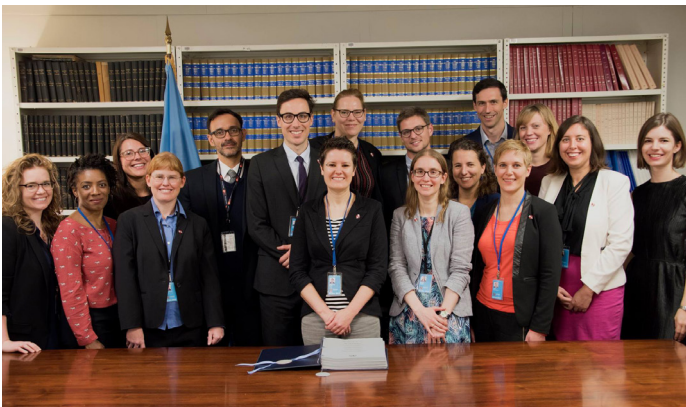
Los miembros de la Campaña Internacional para la Prohibición de las Minas Terrestres (ICAN) ven la copia oficial del Tratado sobre la Prohibición de las Armas Nucleares.

WILPF puede continuar desempeñando un papel activo en esta nueva e importante fase, especialmente a nivel nacional, donde será necesario interactuar con legisladores y funcionarios de gobierno en capital, incluso para fomentar el conocimiento y las relaciones que ayudarán en la implementación efectiva del Tratado.